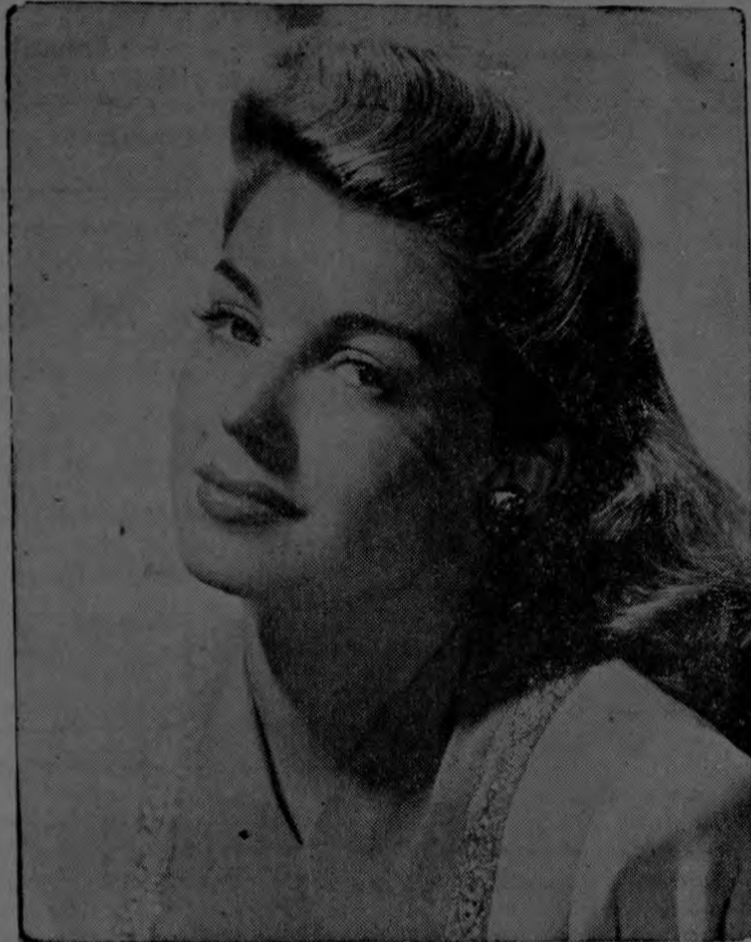
Observe en este retrato de ESTHER WILLIAMS, estrella de Metro Goldwyn Mayer, la decisiva perfección que presentan el maquillaje de labios y el de ojos. El experto de maquillaje Max Factor Jr. le aconseja que se maquille con la misma perfección, si va a hacerse un retrato

El colorete y el lápiz de labios pueden ser los mismos que